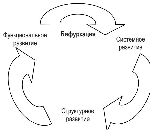
Рис. 2. Цикличность в самоорганизации

Функциональное развитие (замкнутость) – происходит интенсивно в условиях нарастающего дефицита ресурсов и обострения конкуренции. Это